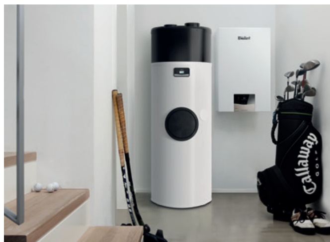
Warmwasserwärmepumpe aroSTOR und Gas-Wandheizgerät ecoTEC exclusive